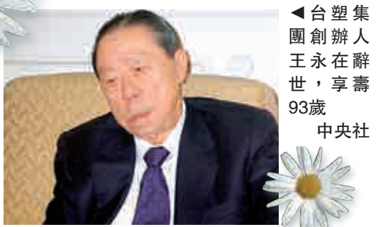
◀台塑集團創辦人王永在辭世，享壽93歲 中央社

【大公報訊】據《聯合晚報》二十七日報道：王永在辭世後，雖然遺留財產新台幣逾700億元（約175億港元）超過兄長王永慶，但因為王永慶適用稅率五成的舊制遺產稅，而王永在適用一成新制稅率，會計師預估王永在遺產稅僅約30、40億元，遠低於王永慶