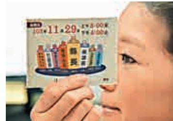
▲選票分成7種顏色

他說，如果國民黨候選人連勝文勝選，台北市與上海市的城市交流在原有的基礎上，可往前走。但若是台北市長候選人柯文哲當選，「可能對滬、台城市交流產生衝擊，也將影響未來的兩岸關係」。嚴安林認為，沒有「九二共識」為基礎的兩岸城市交流是很難推展的。