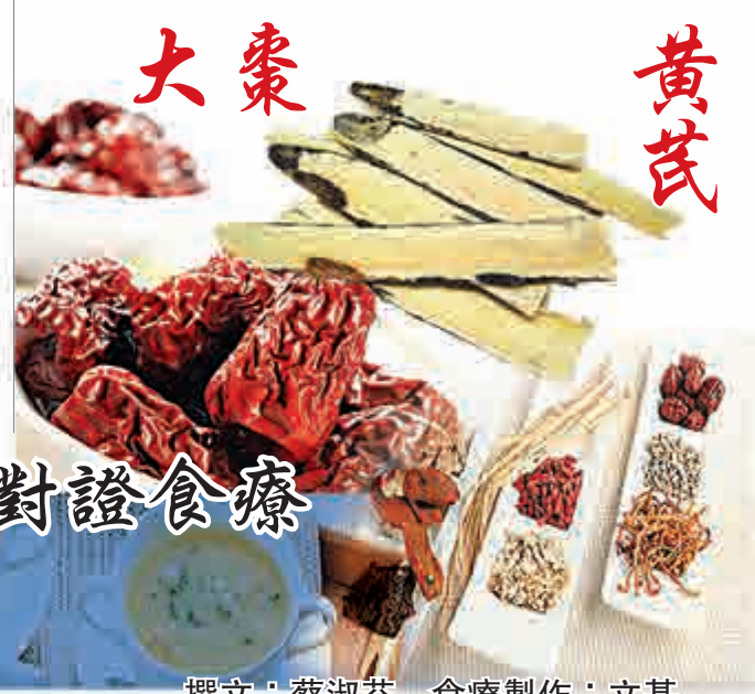
撰文：蔡淑芬 食療製作：文基

紅棗黃芪配合煎湯，是十分普通又簡單易做的補氣養血的食療。黃芪能補一身之氣，兼有升陽，固表止汗，排膿生肌，利水消腫，安神益血的作用，對五臟之虛均有補養作用，尤功專補氣固表；紅棗入湯有很好的健脾益胃、補氣養血、保肝護肝的作用。常吃紅棗可以提升身體的元氣，增強免疫力，可起到養血安神、舒肝解鬱的功效。適量飲用黃芪大棗湯能夠有效改善脾胃虛弱、氣短乏力等症，還能提高人體免疫力，增強抗病能力。黃芪味甘，性微溫，為「補藥之長」，對五臟之虛均有補養作用，尤功專補氣固表。 現代研究，黃芪還有強壯中樞和防癌抗癌的作用。紅棗滋養強壯，健脾和胃，養心安神。二物共煮為湯，既強身健體，又益氣固表，用於氣虛多汗者甚宜。在中醫理論上，「黃芪枸杞紅棗湯」是溫補湯，其中紅棗可以補氣健脾，黃芪可以補氣、補虛，枸杞可以補陽。此湯具有很好的改善和增強人體免疫力，達到防病治病、養生保健的作用。