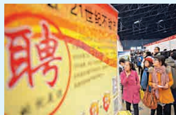
▲分析師建議，要保持明年就業的持續性，必須重視底線管理外，還要進一步放寬鼓勵創業就業的政策