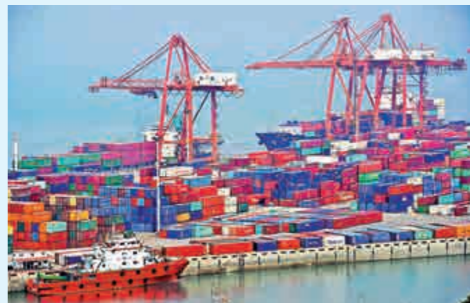
▲專家表示，推動「一帶一路」建設將穩定和擴大中國的出口規模，形成與沿線國家和地區全新完整的產業鏈，實現互利共贏

中國正在加快推進新一輪對外開放，「一帶一路」（「絲綢之路經濟帶」和「21世紀海上絲綢之路」）戰略是新開放格局中的重要一環。內地專家對大公報表示，推動「一帶一路」建設將穩定和擴大中國的出口規模，形成與沿線國家和地區全新完整的產業鏈，實現互利共贏。