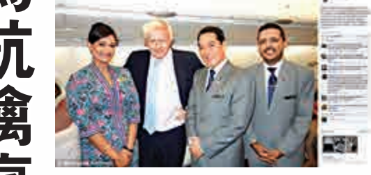
▲約翰遜（左二）和馬航機組人員合照，一名男子疑在航班上發瘋，被機組人員制服

【大公報訊】據英國《每日郵報》4日消息：英國倫敦市長約翰遜近日被拍到身陷一起充滿戲劇性的「空中亂局」，約翰遜當時乘坐一架從吉隆坡起飛的馬航客機，在一萬多米的高空中，協助空乘控制住了一名滿嘴粗口的乘客。 約翰遜的隨行人員波比奇在Twitter上傳照片，圖中顯示5名機組人員扭住了一名男性，波比奇寫道：「對馬航機組人員印象深刻，他們以令人驚嘆的專業化應對一名神智不清的乘客。」 約翰遜的一名發言人表示：「市長與飛機上同行的其他乘客，曾多次試圖消除這位男性的憂慮，但毫無效果」，並表示這名男性已在飛機降落倫敦後被移交警方。這一戲劇性事件令約翰遜乘坐馬航一事得以曝光。 據悉，這名在飛機上神智不清的男性乘客為英國人，他當時在機艙內大聲唱歌，隨後開始大講粗口。約翰遜當時同他坐在一起，並要求他冷靜下來。