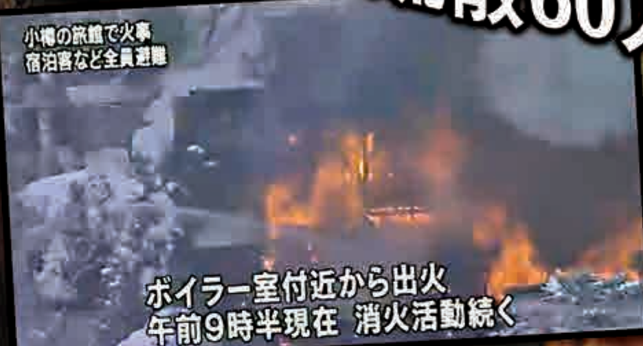
▲「宏樂園」4日上午起火

小樽市朝里川溫泉區的「宏樂園」創立於1957年，當地時間4日上午7時30分，旅館的工作人員發現露天溫泉附近起火，緊急通知消防單位，出動約20輛消防車救援，火勢相當猛烈，直到上午11時才撲滅火勢，起火原因尚待調查。「宏樂園」工作人員表示，意外發生時旅館內有許多外國遊客居住，他們必須逐間拍門、大叫「fire」來叫醒旅客避難。旅館緊急疏散大約60人，包含工作人員與外籍旅客，未傳出有人受傷，目前所有旅客都已被安排入住附近其他旅館。「宏樂園」也在網上貼出停止營業的公告，已經預約的旅客可直接聯絡後續安排事宜。