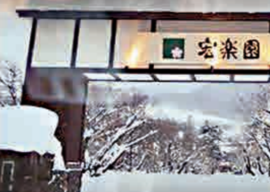
日本北海道小樽市溫泉旅館「宏樂園」 資料圖片

日本北海道小樽市溫泉旅館「宏樂園」4日發生火警，旅館工作人員緊急疏散約60名旅客，消防單位花了近4小時才撲滅火勢，旅館幾乎燒毀，火災原因正在調查。本港入境處確認有17名港人受影響，無人受傷，部分人證件在火災中燒毀。中國駐日本大使館亦有收到求助，正協助有關港人處理遺失證件事宜。有本港旅行團表示，本月內有30多名預約該旅館的旅客受影響，3人已轉到其他酒店入住。據傳，旅館內當時有來自中國香港和台灣、澳洲與韓國的旅客，所幸未傳出有人受傷。