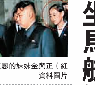
▲金正恩的妹妹金與正（紅圈處） 資料圖片

妹金與正的名字，職責是「黨對外事業部長」，而且朝鮮方面表示，「參加者中的金與正，就是金正恩的妹妹」。 不過，據韓國統一部有關人士說，「勞動黨對外事業部」是未經證實的組織。根據日前獲得朝鮮官方證實的消息，金與正目前只是勞動黨副部長。