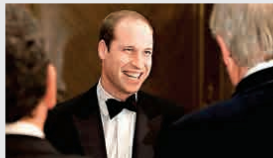
◀ 英國劍橋公爵威廉王子 互聯網

【大公報訊】據法新社6日消息：英國威廉王子和王妃凱特將於7日展開美國東岸的3天訪問行程，期間威廉會前往華盛頓，在白宮橢圓形辦公室和美國總統奧巴馬會晤，並會在世界銀行會議上，就打擊非法販賣野生動物問題發表演說。 威廉伉儷7日抵達紐約，出席皇家基金會及其他慈善組織的活動，期間會推動保育、年輕人心理健康及支援弱勢年輕社群。 威廉會在8日轉往華盛頓，在白宮橢圓形辦公室與美國總統奧巴馬會面，並出席世界銀行會議，就非法販賣野生動物發表演說，又會和副總統拜登夫婦會面。 預產期在明年4月的凱特不會到華盛頓，訪問期間會一直留在紐約，並會在紐約市長白思豪夫人麥克雷的陪同下，參觀當地一間兒童發展中心。現已17個月大的喬治小王子，不會隨同父母外訪。