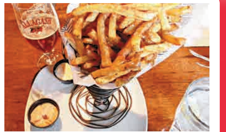
▲ 比利時薯條

【大公報訊】據路透社5日消息：本周是比利時的「國家薯條周」，自稱是薯條發源地的比利時，業者最近發起將比利時薯條列入聯合國非物質文化遺產的活動，並積極尋求民眾簽署，希望文化部能向聯合國申請，將比利時庶民小吃發揚光大。 比利時薯條通常放在紙捲裡，讓民眾從薯條攤或薯條餐車買來吃，配備的醬料種類繁多，從番茄醬、咖喱番茄醬、塔塔醬、蛋黃醬、起司醬到海鮮醬應有盡有。比利時這種小攤和餐車約5000個，若按人均計算，比利時薯條比美國麥當勞餐廳還要普遍10倍。