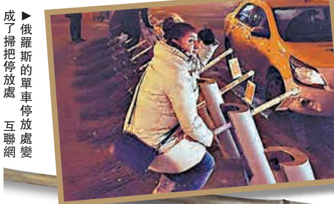
▶ 俄羅斯的單車停放處 成了掃帚停放處 互聯網