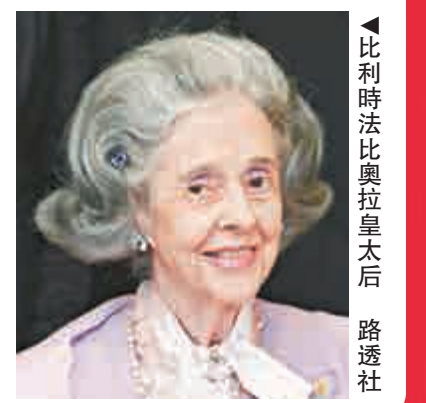
◀ 比利時法比奧拉皇太后

后，1993年國王包杜恩在西班牙度假時驟逝，艾伯特二世（Albert II）和波拉（Paola）繼任國王和王后後，法比奧拉就淡出公眾目光。