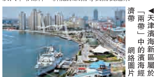
▲天津濱海新區屬於「一帶一路」中的濱海經濟帶

一是京滬北段經濟帶：京滬北段北起北京，經保定、石家莊、邢台到邯鄲。該區域要發揮加工製造業現有基礎與地緣優勢，重點發展能源、原材料、醫藥、紡織服裝、食品等產業，積極發展汽車零部件、新能源設備等裝備製造業。