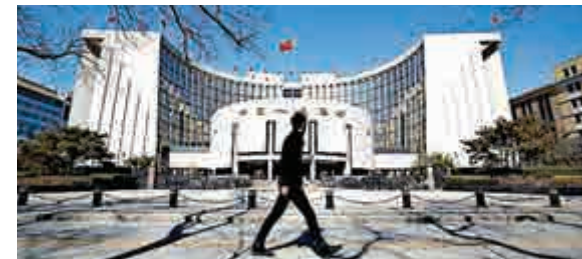
▲一位行人走過中國人民銀行