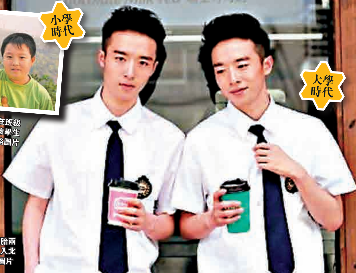
▲兩人小學曾在班級倒數，被列入壞學生名單