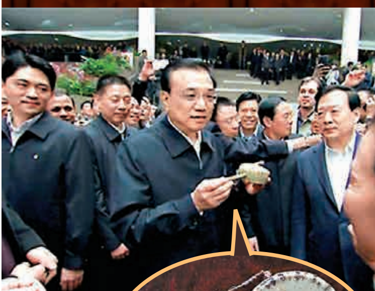
▲11月20日，李克強總理在義烏獲贈一隻50多年前的撥浪鼓作為禮物

萊赫·卡欽斯基(圖左)、雅羅斯瓦夫·卡欽斯基(圖右) 57歲的萊赫·卡欽斯基和雅羅斯瓦夫·卡欽斯基分別於2005年、2006年擔任波蘭的總統和總理。