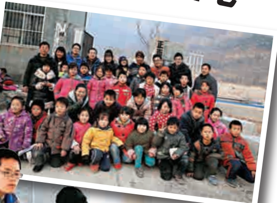
▲支教學生與正面完全小學師生合影留念