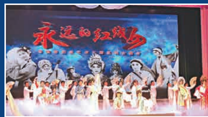
▲「永遠的紅線女——粵劇界紀念藝術大師紅線女晚會」表演現場