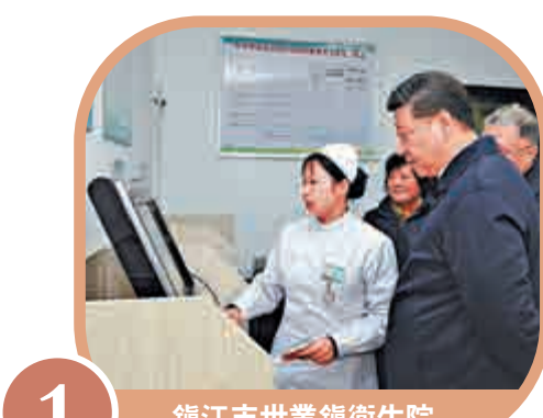
1 鎮江市世業鎮衛生院

夜幕降臨後，習近平從鎮江驅車近100公里來到南京市考察江蘇省產業技術研究院。習近平認真聽取研發工作介紹，不時詢問有關情況。在成果展示區，他拿起石墨烯氣體阻隔膜，了解產品性能、市場應用、產業前景等，習近平說，實現經濟持續健康發展，必須依靠創新驅動。要深入推進科技和經濟緊密結合，推動產學研深度融合，實現科技同產業無縫對接，不斷提高科技進步對經濟增長的貢獻度。