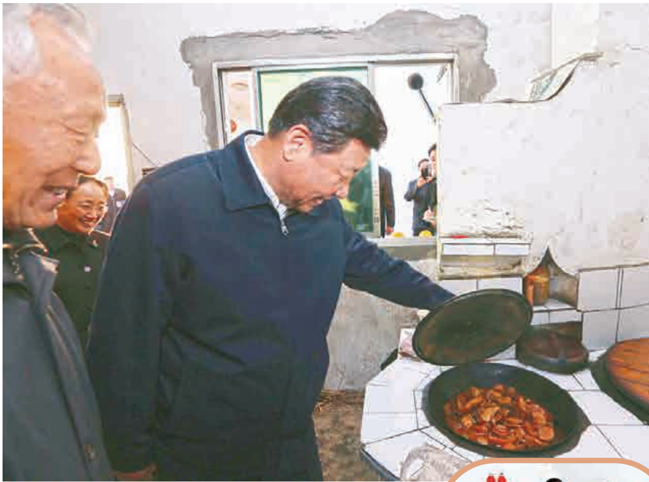
▲習近平走進鎮江村民家中，揭開鍋蓋體察民情