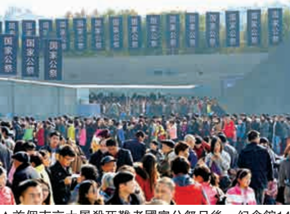
▲首個南京大屠殺死難者國家公祭日後，紀念館14日參觀人數創歷史新高

「廣州市委原書記廖慶良多次出入高檔會所的具體場景是怎樣的？這些我們都進行了獨家還原和披露。」這位負責人說，許多當事人違了紀，受了處分，不太願意在大庭廣眾之下露臉。我們做了大量溝通協調工作，有關地區紀委也給予大力支持，最終一些當事人才同意站出來談反思、談教訓。