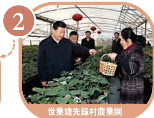
2 世業鎮先鋒村農業園

習近平在鎮江世業鎮衛生院了解基層醫療改革和服務情況。當得知這裡實現了雙向診療常態化，總書記給予肯定。他指出，人民群眾對醫療服務均等化願望十分迫切。像大城市的一些大醫院，始終處於「戰時狀態」，人滿為患，要切實解決好這個問題。