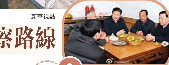
3 世業鎮永茂圩自然村

在園區草莓種植基地門口，擺放着這裡生產的草莓、橘子、葡萄等。習近平駐足觀看，拿起產品詢問產量和市場價格。他走進草莓大棚，實地察看草莓生長情況，問草莓品種從哪裡來，種植用的是不是營養鉢，一畝地投入多少錢，一年純收入有多少。他還回憶起上世紀80年代在河北正定工作時，曾專門到滿城考察引進草莓新品種。