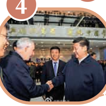
4 惠龍易通物流公司

習近平走進村民洪家勇家。院落寬敞乾淨，門前河水潺潺，菜地綠綠。習近平走進廚房，開冰箱、揭鍋蓋、擰龍頭。總書記同他們一家圍坐在一起，拉家常、談生產、問民需。