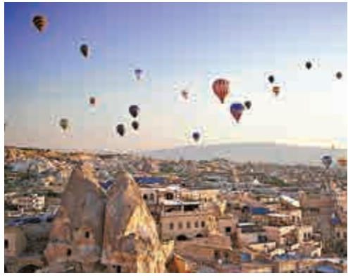
▲卡帕多奇亞是熱氣球旅遊勝地 互聯網

【大公報訊】據英國廣播公司17日消息：土耳其中部旅遊勝地卡帕多奇亞（Cappadocia，別稱奇石林）17日發生一起熱氣球墜落事故，當地媒體說造成1死多傷，經中國大使館核實，已造成中國遊客1死4傷。 據報道，事發於當地17日早上8時許，當時遊客正乘坐熱氣球觀光；有熱氣球撞落地面，造成1人死亡15人受傷，傷者中有中國人和馬來西亞人。事發後多輛救護車、大批安部隊及緊急救援人員到場，搶救傷者。負責營運的公司亦有