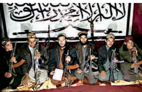
▲6名血洗學校的巴基斯坦塔利班好戰分子