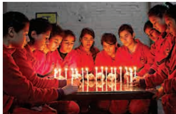
▲印度學校於17日為巴國遇難學生哀悼

【大公報訊】據《獨立報》、《今日美國》17日消息：美國賓夕法尼亞州涉嫌槍殺前妻一家6口的退役美軍斯通，被發現伏屍費城住所附近一處叢林，相信是自殺身亡。當地警方在搜索超過一天半後，於當地16日下午在費城近郊發現他的屍體，他身上有多處割傷，顯然是用利刀割腹。