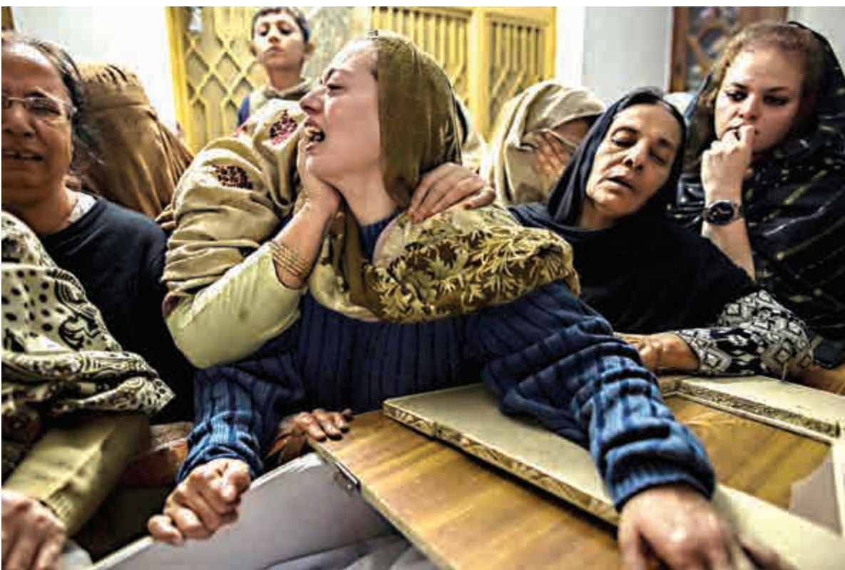
▲一名母親為在事件中喪生的15歲兒子送殯

巴基斯坦塔利班和阿富汗塔利班是不同的組織，但是結盟。二者的目標都是推翻政府，建立伊斯蘭國。