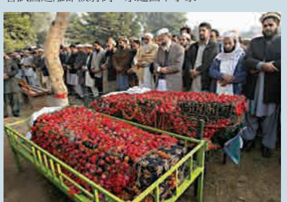
▲民眾為在事件中喪生的學生舉辦葬禮