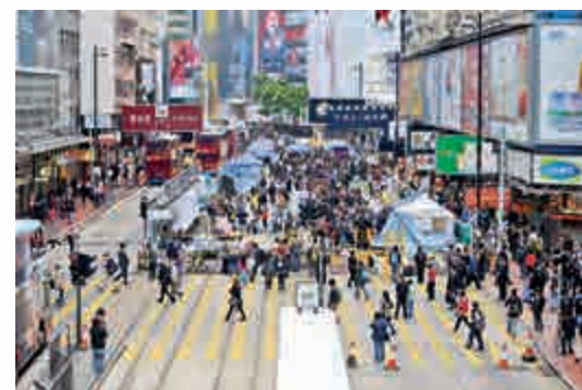
佔中發生了近80天，對香港社會帶來前所未有的衝擊