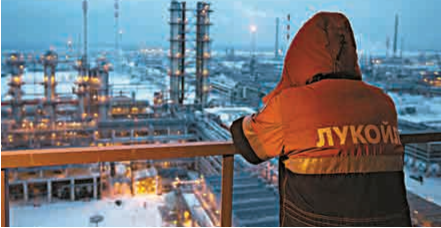
►國際油價急跌，近日盧布崩盤，俄羅斯能否撐得住仍是未知之數

「以史為鑒，可以知興替。」為政者需要，從商者需要，做人同樣需要。現在教育局計劃推行初中中西史課程更是必要的，重點是如何引起學生學史的興趣。如果普京讀過這個故事起碼可以早作謀劃，而不至於陷入現在困境。