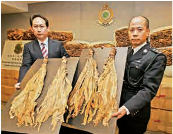
▲海關人員展示檢獲的走私煙草

【大公報訊】海關破獲近十年最大宗走私煙草案。關員日前在香港國際貨櫃碼頭，截獲1.2萬公斤由內地經港偷運到澳洲的未製成煙草，總值15.6萬元，估計一旦製成捲煙後，可牟利3800萬港元。