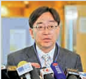
▲高永文希望透過提供免稅額，提高計劃的吸引力 資料圖片

高永文昨在一個電台節目表示，理解保險業界對自願醫保計劃有一定憂慮，政府會繼續向業界解釋。回應