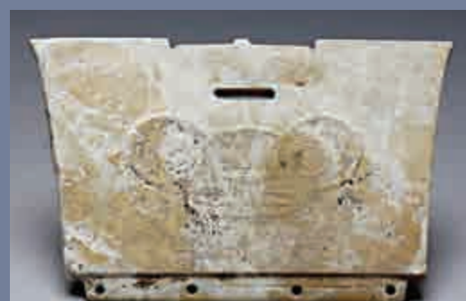
玉梳背 反山遺址出土