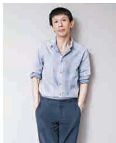
▲林奕華曾兩度奪得上海壹戲劇大賞年度最佳導演

【大公報訊】曾兩度奪得上海壹戲劇大賞年度最佳導演的林奕華將於明年一月把四大名著系列壓軸之作《紅樓夢》搬上舞台。林奕華自二〇〇六年把四大名著陸續搬上舞台。由《水滸傳》看男人之罪、《西遊記》看生活之難、《三國》看人心之變，直至今次最終章《紅樓夢》看每個人都要補自己的洞，作品試圖顛覆人們對這些經典小說的既定印象與看法，探討及剖析現代人的焦慮。