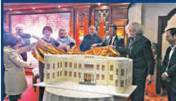
▲中外嘉賓為俄羅斯藝術展覽館模型揭幕