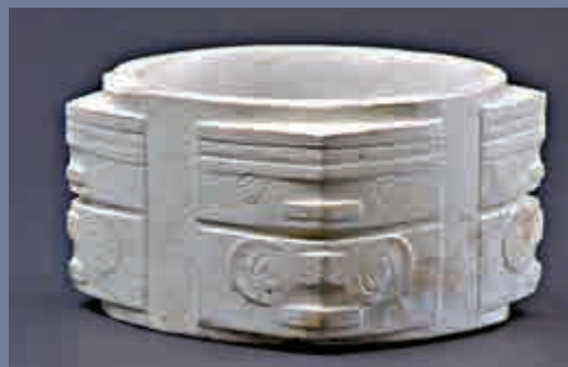
玉琮 瑤山遺址出土

此次玉琮展品中，其中一件玉質沁為黃白色，為杭州餘杭區瑤山遺址出土，矮方柱體，對鑽大孔，外壁略弧凸。以轉角為中軸，刻神人獸面組合神徽