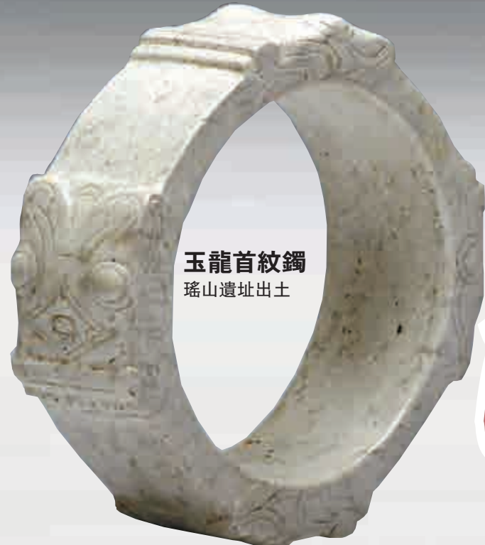
玉龍首紋鐲 瑤山遺址出土