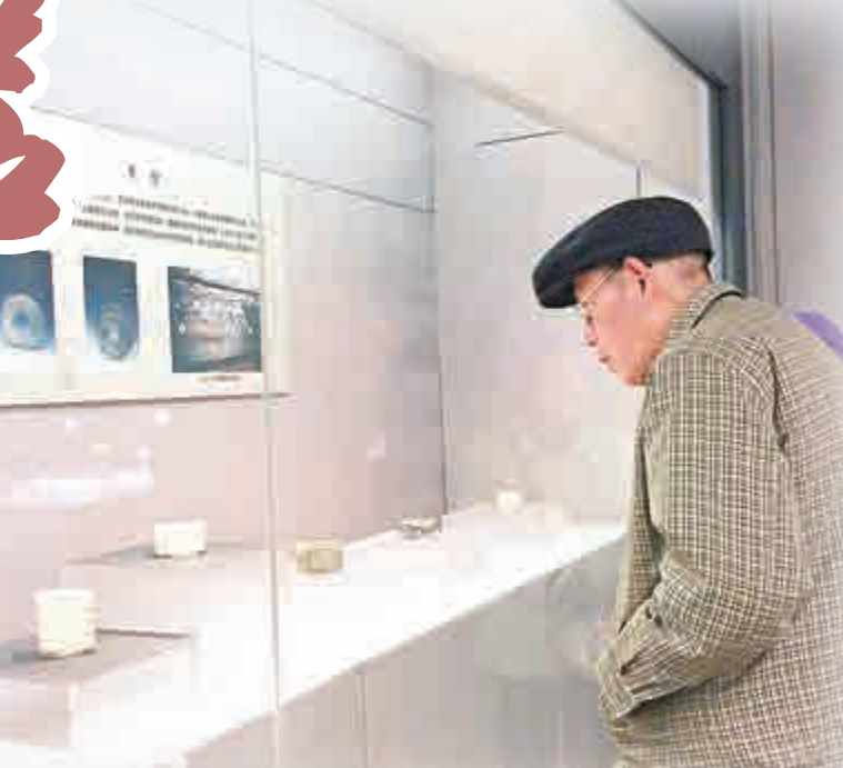
南京市民觀看良渚玉器展

。另一件玉琮也分外搶眼。其玉質沁為雞骨白色，外方內圓，以四角展開以陰刻和淺浮雕的手法雕琢兩節簡化的神徽圖案，管鑽眼，刻有眼角。象徵着擁有者的尊貴身份。