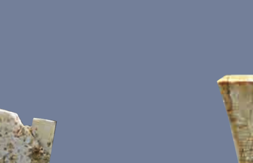
玉牌飾 瑤山遺址出土