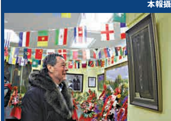
▲俄羅斯藝術家在欣賞作品

【大公報訊】記者付彥華、于海江哈爾濱報導：時值中俄兩國正式建交六十五周年，昨日，二〇一四中俄文化藝術交流展覽俄羅斯藝術展覽館二十周年館慶在哈爾濱太陽島舉行，來自中俄兩國文化、藝術等各界人士參與活動。