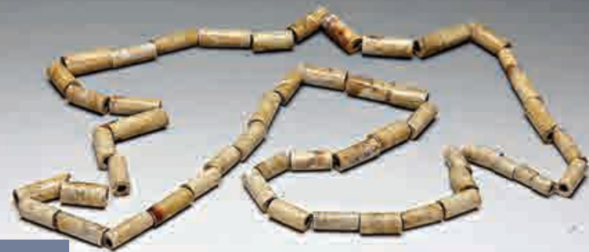
玉管串 匯觀山遺址出土