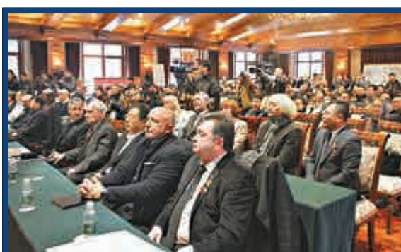
▲俄羅斯藝術展覽館二十周年館慶現場