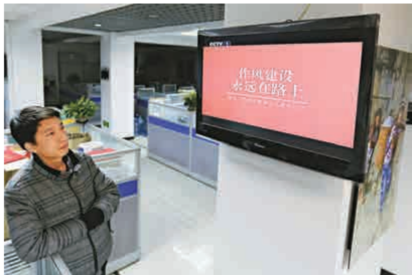
▲12月15日，北京市民收看中央電視播出的中紀委推出的專題片

另外，本月12日中紀委首次在中央辦公廳、中央組織部、中央宣傳部、中央統戰部、全國人大機關、國務院辦公廳、全國政協機關等中央和國家機關，新設7家派駐機構，各機構負責人目前暫未公布。