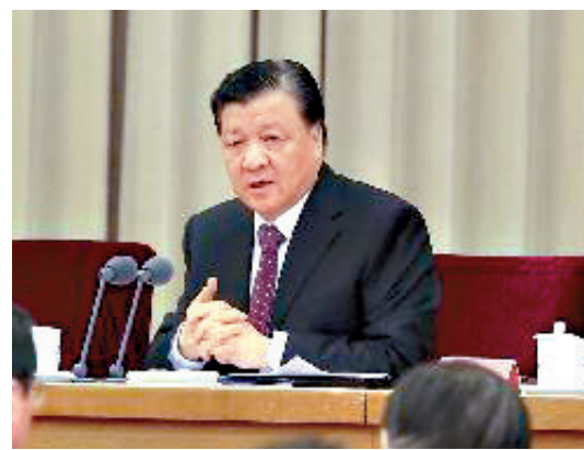
▲19日，全國組織部長會議在北京召開。中共中央政治局常委、中央書記處書記劉雲山出席會議並講話