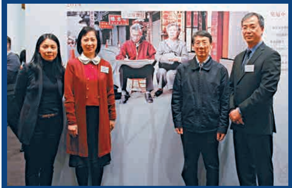
▲眾嘉賓在吳冠中夫婦合影前留影