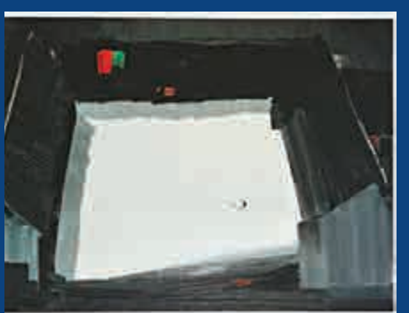
▲吳冠中作品《四合院》，用黑、白、塊、面來紀念當時的艱難時光

每幅作品背後都包含了吳冠中的故事。站在作品《四合院》前，吳可雨講及當年他們一家住在四合院的艱苦歲月，感觸良多。他回憶起有一年冬天，吳冠中用紙糊牆，在往牆紙刷漿糊的時候發現糊牆的高麗紙紙質很軟，而且很結實，很適宜拿來畫畫。因此，吳冠中先生的早期作品都