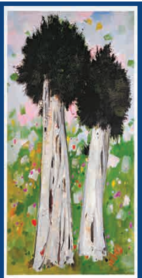
▲吳冠中以畫作《伴侶》抒發自己對太太的感情