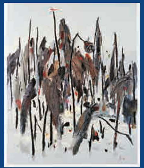
▲作品《冰雪殘荷》，吳冠中以蜻蜓比喻自己積極的心境