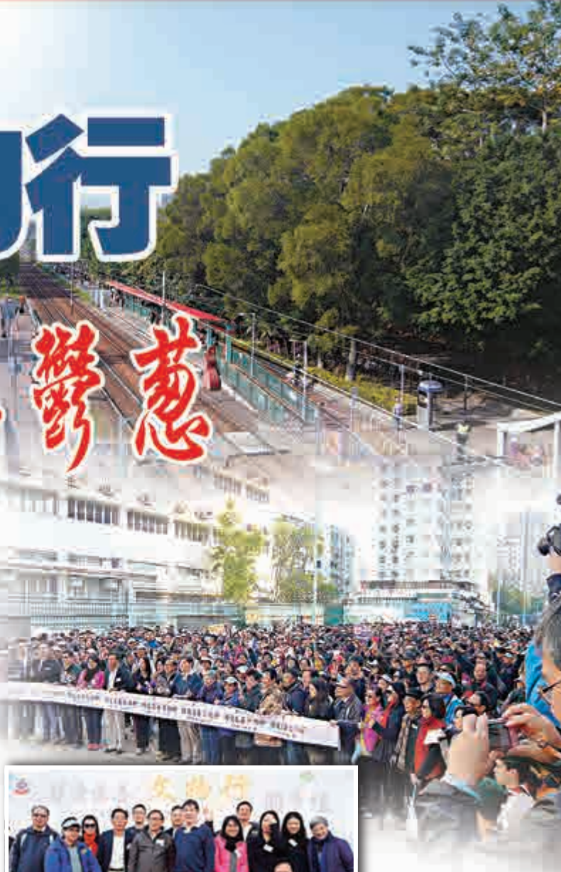
博愛慈善文物行起步禮