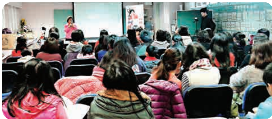
▲長城杯中國文化藝術大賽吸引數百學生和家長參與