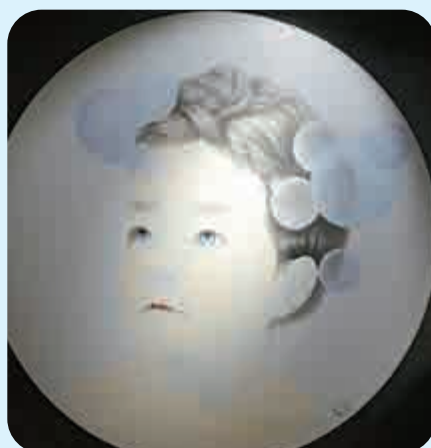
▲《整裝待發》寓意被拯救的自己 本報攝