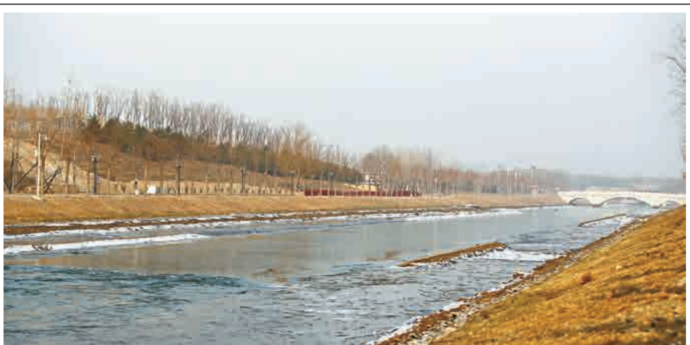
▲12月27日，開閘後江水在圍城湖明渠破冰前進，準備輸送到北京市各個水廠

對此，北京市南水北調辦相關負責人已明確表示，水價調整與北京使用南水並無必然關聯，北京居民不會因為全部或部分使用南水而被單獨加價，北京市內仍將繼續實施境外水與本地水「同水同價」，即使水價調整也會按照價格調整程序進行，調整範圍將為整個北京市。