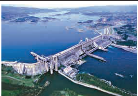
▲中線工程起點丹江口水庫