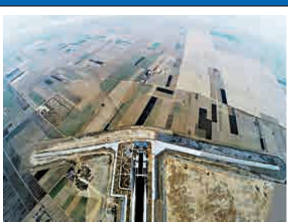
▲穿黃(黃河)工程北岸景色