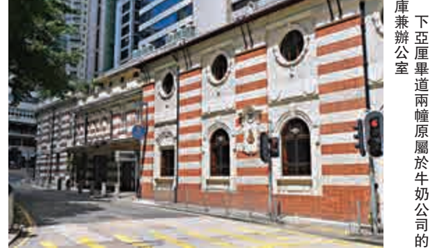
下亞厘畢道兩幢原屬於牛奶公司的倉庫兼辦公室

由於牛奶公司的生意多元化，並擁有大片具潛質的土地，成為了香港置地的靚靚目標，結果在一九七二年爆發收購戰。