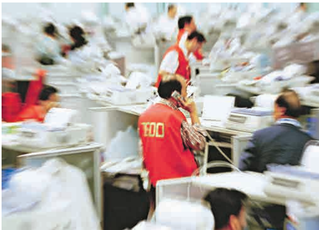
淡友反戈一擊，大市由頭跌到尾，前日的四二三點的進帳，昨日跌去一半有多