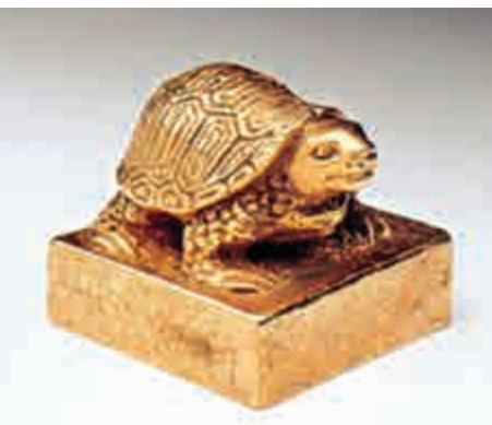
附圖的龜鈕，表現鑄造者功力與巧心，寫形傳神，生趣宛然；古印不論金、銀、銅、玉所製，印頂多有鈕作裝飾；《說文》指出：即「印」也。漢代印鈕圓雕盤龍或螭虎者，皆為皇帝御用（後者也可為皇后用印）。像廣州南越王墓出土之《文帝行璽》金印，印鈕便作盤龍。龜鈕金印則為列侯、丞相等高官所用。

間性間情 兩漢此類出土金印，幾乎皆藏於各大博物院和文物研究所。真品流落民間者絕少。坊間近仿品甚多，不但鑄造法和含金量不同；而最大破綻是印文，與漢代鑄刻方式有別。