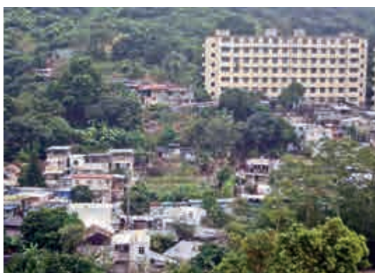
薄扶林村內空置約十年的前牛奶公司宿舍

牛奶公司的牧場於一八八六年設立，高峰期的範圍由今天瑪麗醫院對落的沙宜道伸延至置富花園。版圖內除了有大片牧牛場外，還有牛棚、石圍欄、儲存牛糞和牧草的石屋、豬舍、水池、飼料店、食物店、冷凍廠、機房、辦公樓、職員宿舍，以及一條連接海邊碼頭的山路。