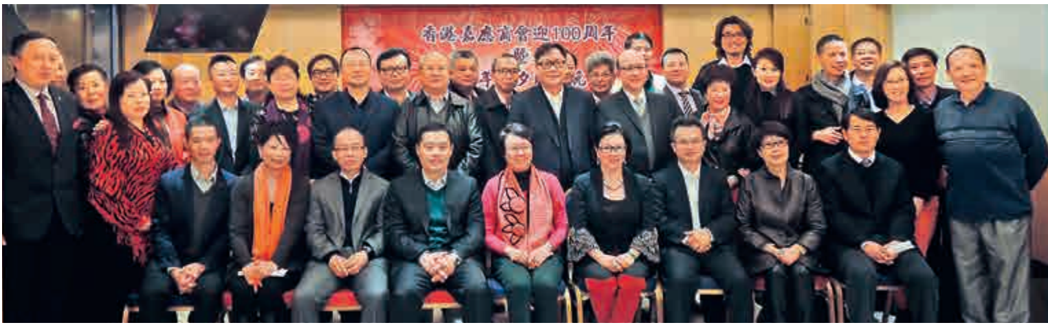
▲嘉應商會舉辦迎新新年晚會，嘉賓與會董合照

新年來臨之際，香港嘉應商會前日於會所舉辦二〇一四年除夕迎新新年晚會，嘉賓首長、會董會員逾百人歡聚一堂，暢敘鄉情，迎接新年。