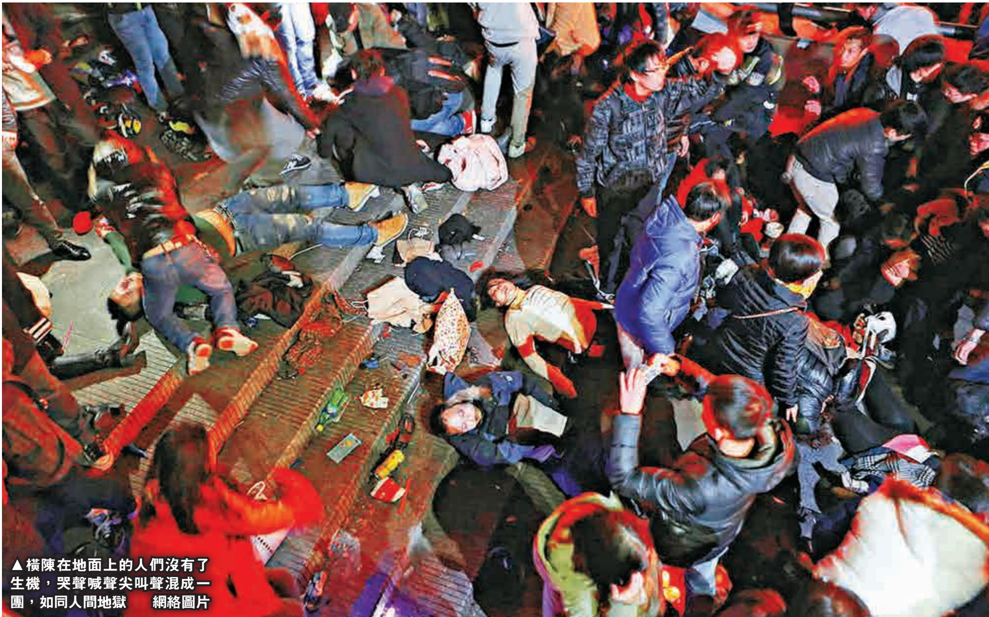
▲橫陳在地面上的人們沒有了生機，哭聲喊聲尖叫聲混成一團，如同人間地獄