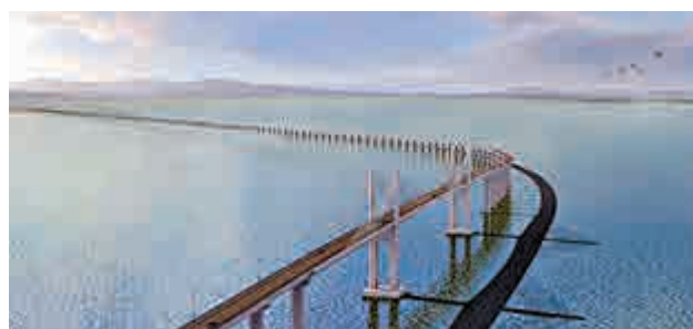
▲廣東省最長跨海大橋——南澳大橋

【大公報訊】廣東省最長跨海大橋——南澳大橋1日正式通車試運營。這是廣東省內第一條真正意義上的跨海大橋，是連接廣東唯一海島縣南澳縣和大陸的跨海大橋。