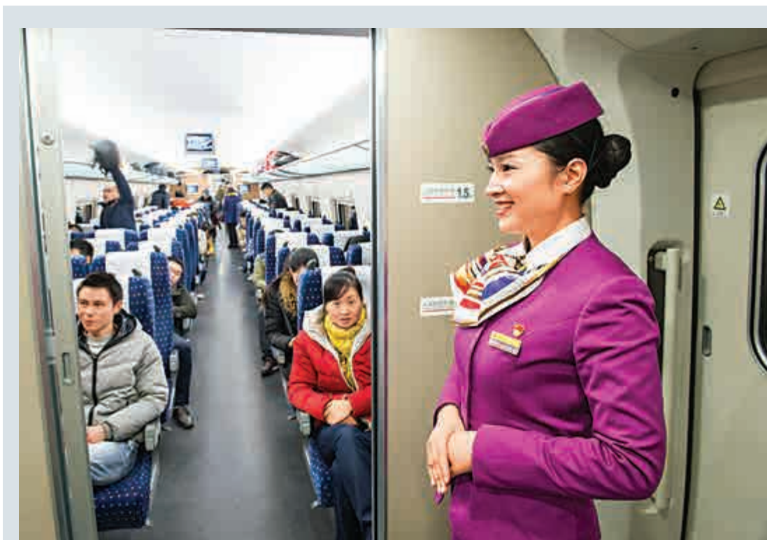
▲1月1日，重慶客運段的乘務員在首趟重慶至北京高鐵路車門內迎接旅客登車

針對元旦期間廣東地區往長沙、南寧、桂林、貴陽、廈門方向的高鐵車票較為緊張的情況，廣鐵集團將增開高鐵42趟、普鐵22趟，預計發送旅客360萬人，日均發送旅客90萬人，同比激增29.6%。高鐵路線，廣鐵將在京廣、滬昆、廣深港高鐵路實施周末運行圖，適度組織動車組重聯運行。其中，京廣高鐵路假期期間增開廣州南至武漢、長沙南、深圳北方向18趟周末列車，南廣高鐵路增開「深圳北—南寧東」1次2趟高峰列車。