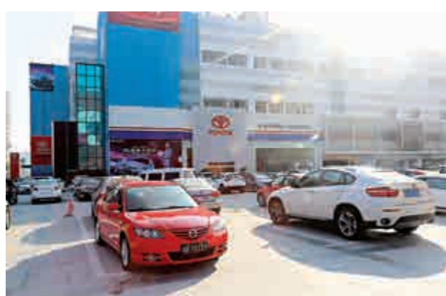
▲深圳龍華名車城無人問津

某家汽車銷售人員告訴記者，這次的汽車限購來得太突然，沒有任何準備，現在不知如何是好，有點措手不及，未來的業績肯定會直線下滑，準備另謀出路。