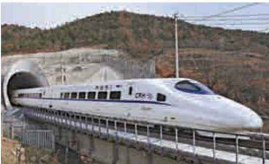
▲山東青榮城際鐵路即墨至榮成段去年底開通運營