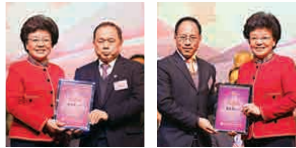
林鄭月娥（右）頒發鳴謝狀予永遠榮譽會長張茵