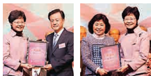
林鄭月娥（左）頒發鳴謝狀予永遠榮譽會長許榮茂