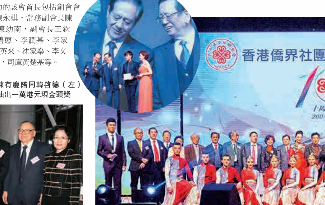
該會首長等與表演嘉賓合照