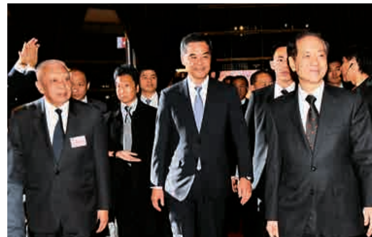
右起韓啓德、梁振英、董建華等主禮嘉賓入場

他希望香港僑胞抓住機遇，發揮資金、技術、管理等優勢，主動適應國家經濟發展新常態，積極投身「一路一帶」建設，彰顯僑界作為。望聯會更加廣泛團結僑界同胞，特別是青年一代，堅定不移按基本法辦事，支持政府依法施政，壯大愛國愛港力量。