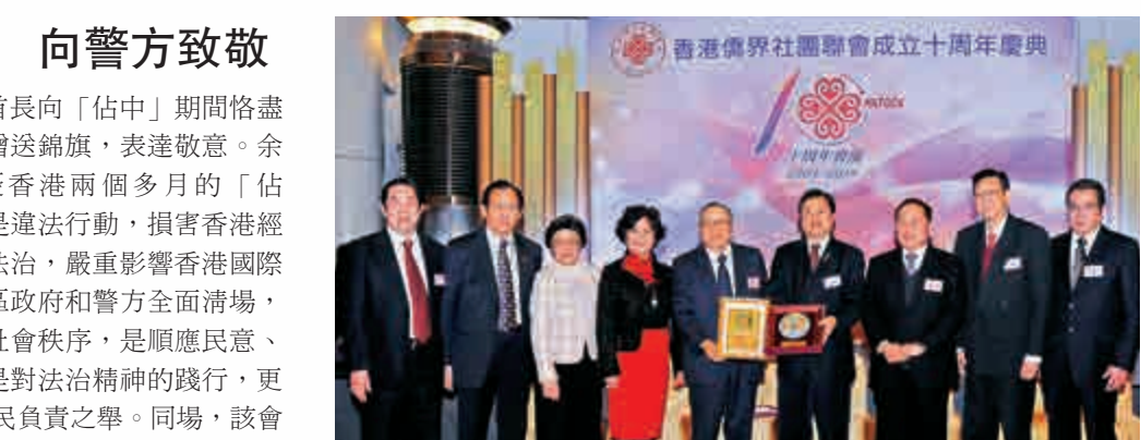
與內地友好團體互贈紀念品