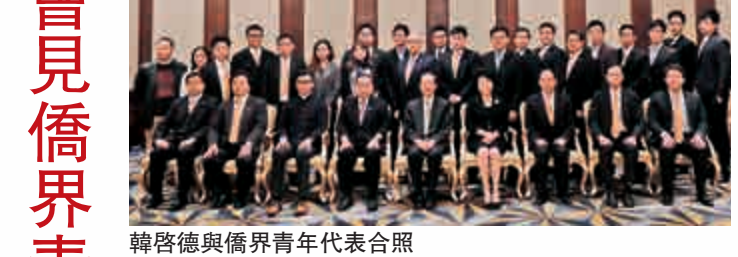
韓啓德與僑界青年代表合照

韓啓德——聽取青年人的意見後表示，香港有很好的基礎，經濟每年都在發展，這是「一國兩制」的成功實踐。他對香港的發展前景非常樂觀，但香港需要有更好的遠景設計，在科技創新等方面仍有很大發展空間。談及年輕人問題，他表示，年輕人要有世界的視野和歷史的高度來看待香港的問題，尋找香港的前景，希望僑界青年在前輩的帶領下為社會貢獻。