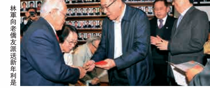
林軍向老僑友派發新年利是

12月21日，中國僑聯主席林軍到港僑聯會所慰問香港老僑友，與大家親切交流並派發新年利是。