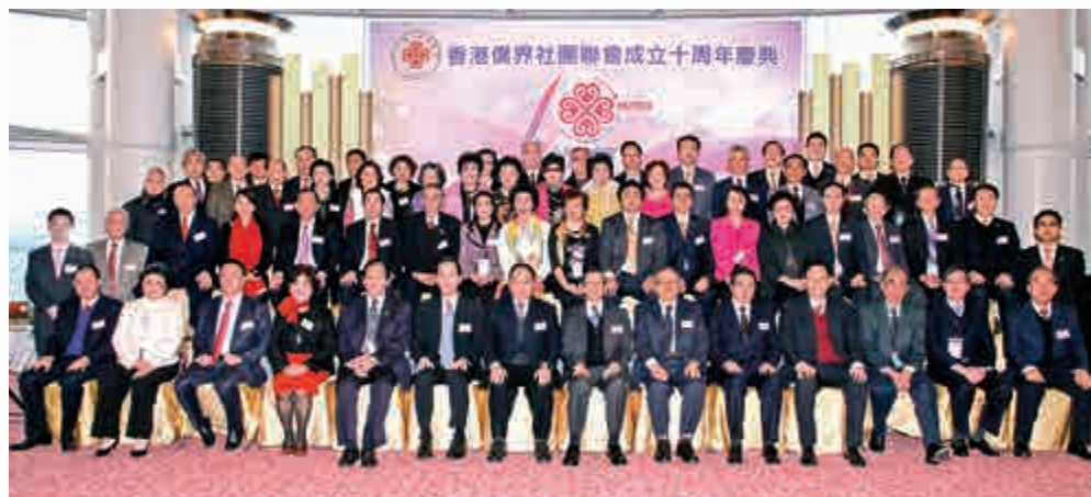
該會董事在慶典前大合影