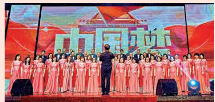
該會合唱團表演大合唱