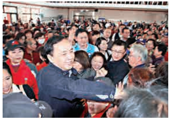
▲參選國民黨主席的新北市長朱立倫(前)，4日在嘉義舉辦政見說明會，黨員爭相握手

政見會也發生一段小插曲，當朱立倫演講時，突然有一名老婦人疑似情緒高昇昏倒在地，所幸經醫護人員按摩後恢復意識，並無大礙。