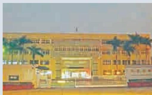
▲矯正署5日開會審核扁保外就醫案。圖為矯正署外觀