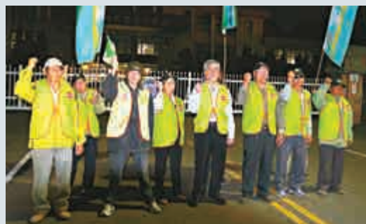
▲挺扁團體4日號召民眾在台中監獄前守夜，希望5日扁能順利返家