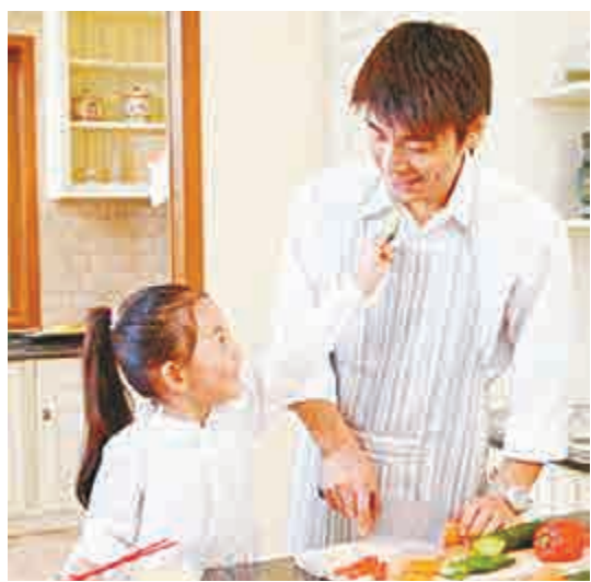
▲島內愈來愈多男性擺脫養家重擔

不過，雖然近年來男性為了照顧家庭退出職場比率的確有攀升，但擔起照顧家庭責任的還是以女性為多，家庭主婦人數仍壓倒性的多，高達240多萬人，也是女性退出職場的最主要原因。