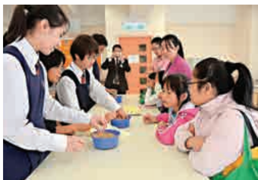
▲天水圍香島中學早前舉行升中簡介會，期間又舉行科學小實驗

作為天水圍區一所優質的直資中學，學校強調全人教育，着重培訓學生的思考力、分析力、創造力，更採取靈活、多元化的教與學方法。因此，學校當日的活動安排，正好表現學校獨有的遼闊學習空間，及其培育全人的教學理念。當日參觀者紛紛表示校園設備齊全，活動多樣化，此行不但知悉天水圍香島中學的收生準則，更能親身參觀校舍，對學校的辦學投以信任一票。