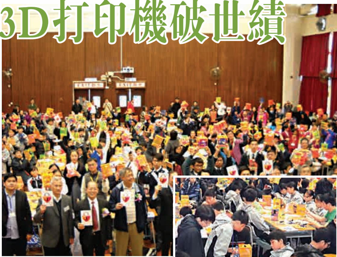
▲四十三間學校學生即場製作3D打印機，與主禮嘉賓締造世界紀錄團體大合照

由香港四邑工商總會陳南昌紀念中學、香港創意開放科技協會合辦「『愛心香港』之3D打印世界紀錄」聖誕前假該校禮堂舉行，逾二百人來自四十多間中小學即場製作194台3D打印機，稍後並同時打印194台3D打印機，以打破2014年四月由美國Le Tourneau University創下的世界紀錄。 大公報記者 黃穎雅