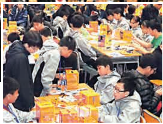
▶學生在組裝3D打印機

比賽開始前，學校老師先派發每校一本組裝打印機說明書，並即場教授各校學生如何「砌機」，之後利用電腦設計圖案，以200部3D打印機同時打出「我愛香港」字樣的鎖匙牌，以此表達愛親人的心意，並將這份愛心傳遍香港，共同建立一個互助互愛的社會。香港創意開放科技協會主席蘇孝恆、立法會議員莫乃光、中文大學教育學院莊紹勇教授、新一代文化協會科學創意中心總監黃金耀、香港四邑工商總會陳南昌紀念中學校長陳千里等主禮嘉賓一同見證這次盛舉。 早上十一時比賽正式開始，參賽學生在老師、家委會家長協助下「砌機」，至下午一時許在主禮嘉賓見證下，由黃金耀總監宣布完成194台3D打印機完成組裝，其後，200部打印機即場打印，以打破世界紀錄。