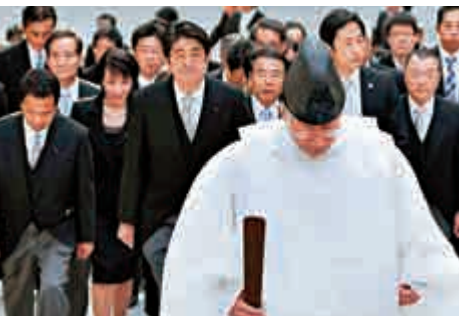
▲日本首相安倍晉三（中）5日參拜了位於三重縣內的伊勢神宮

1日，日本天皇發表新年致辭稱，今年是二戰結束70周年，日本應藉此機會充分學習「九一八事變」以來的戰爭歷史，思考今後應成為怎樣的國家。同日，安倍稱，日本戰後在對戰爭進行深刻反省的同時，作為自由、民主國家