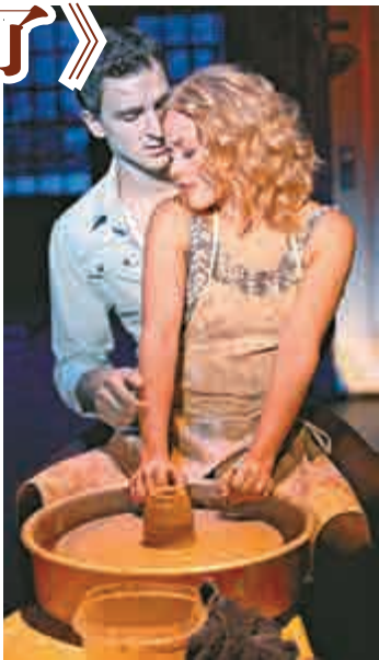
▲音樂劇《人鬼情未了》劇照

音樂劇《人鬼情未了》將於五月至八月在北京、上海、青島、重慶、廣州等城市上演，五月十五日至二十二日在深圳保利劇院連演八場，是此次亞洲巡演首站。