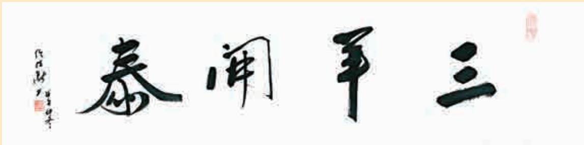
▲世界宗教和平會主席任法融題寫書法作品「三羊開泰」

「汪國新畫展」由中華文化城有限公司、堅力控股有限公司主辦，大公報、麗新集團、中國建設銀行香港分行協辦；展場位於中環CCB-TOWER（中國建設銀行大廈）一樓展廳，展期至一月九日。