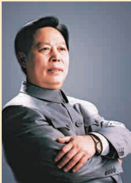
▲任法融書法作品 ▲中國當代書畫家汪國新