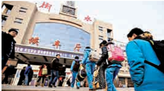
▲學生在老師帶領下排隊進站，乘火車回京

比北京要寬鬆很多，並不需要有河北戶口，所以除了北京孩子外，周邊河南、湖北等省也有在我們學校讀書的。」