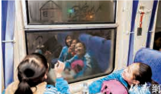
▲開心的「小候鳥」忍不住在車窗上寫下「回家」

也正是由於這種需求，衡水除了英才學校，還出現兩所寄宿制學校接受這樣的「候鳥」孩子，每月往返於北京和衡水上學的孩子超過千人。（北京青年報）