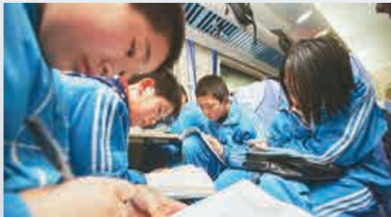
▲同學們在列車上抓緊時間寫作業