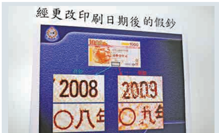
▲歹徒將偽鈔08及〇八年(左)年份，改為09及〇九年(右)

事件涉及中銀及滙豐千元鈔票，當中有中銀2003年防偽版千元面額鈔票，先後在03、05、06、07及08年5度發行，偽鈔有齊變色銀碼、開窗式安全線、熒光條碼、凹凸圖案、水印等；甚至連鈔票編號亦各有不同。事件一度引起恐慌。