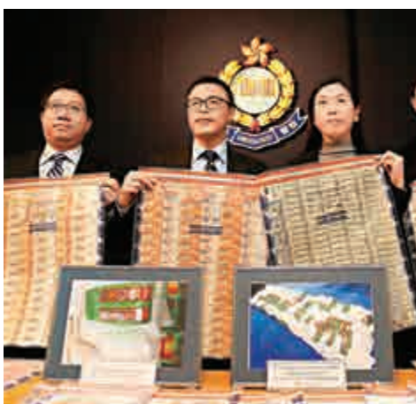
▲毒品調查科人員展示8.06億元冰毒案證物

【大公報訊】記者周慶邦報導：中、港、印尼三地聯手瓦解一個由港人主導活躍亞太區三年的跨境販毒集團。本月初印尼及本港執法人員，同步採取行動拘捕13人，包括長居印尼的香港大毒梟，緝獲862公斤總值高達8.06億港元毒品冰，凍結非法收益財產逾1700萬元。