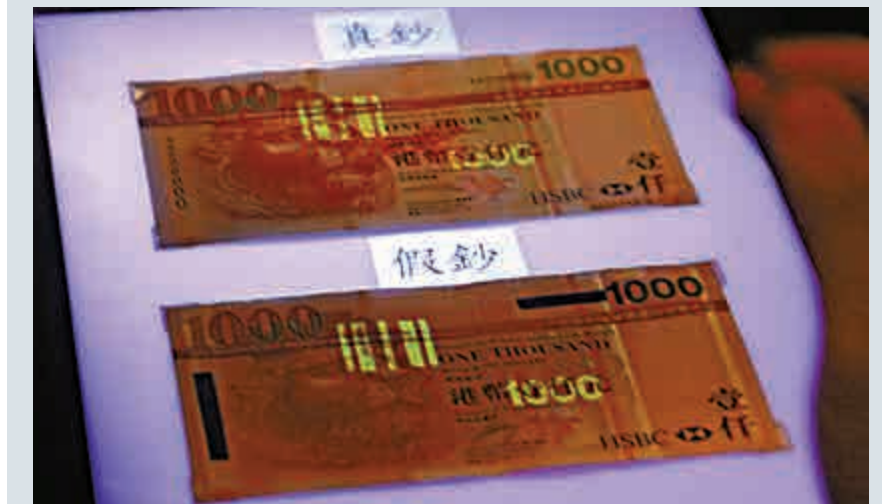
▲高清图版偽鈔(下)熒光條碼仿真度極高，與真鈔(上)非常接近