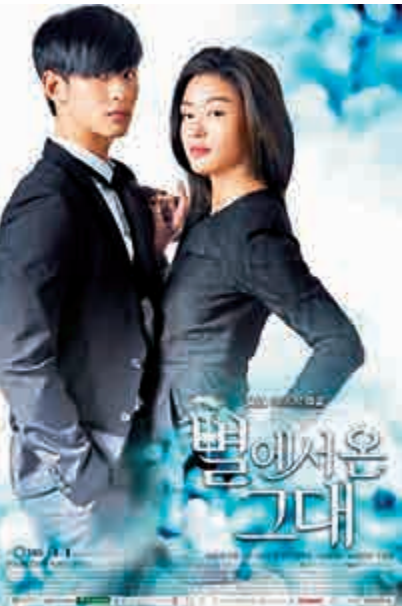
▲《來自星星的你》爆紅後，眾人紛紛學韓劇、食炸雞、飲啤酒、化妝韓、說韓語

國家主席習近平去年初訪問韓國，於首爾大學發表演講，談及兩國關係：「中韓兩國毗鄰。百金賣屋，千金賣鄰，好鄰居金不換。」他發表《共創中韓合作美好未來，同襄亞洲復興繁榮偉業》的演說：「從東漢求仙來到濟州島的徐福，到金身坐化九華山的新羅王子金喬覺；從在唐朝求學為官的《東國儒宗》崔致遠，到東渡高麗、開創孔子後裔半島一脈的孔紹；從在中國各地輾轉27年的韓國獨立元勳金九先生，到出生於韓國的《中國人民解放軍軍歌》作曲者鄭律成。韓國古代詩人許筠，寫下「肝膽每相照 冰炭映寒月」，形容中