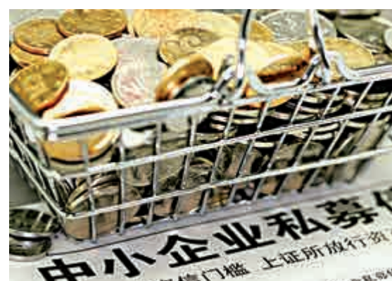
▲滬深交易所禁止個人投資者購買私募債

有私募債承銷人士表示，對擔保公司進行盡職調查，拉長了私募債發行周期，也增加了發行費用，會導致私募債發行成本進一步上行。