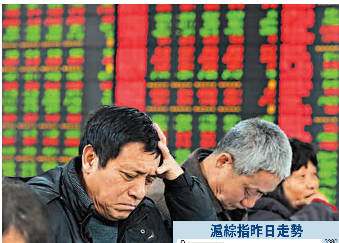
▲金融內房引領回調，A股周四大跌近2.4%，失守3300點關口

高善文並預計，根據以往趨勢推斷，2015至2020年中國商品銷售面積同比增速3%，而全社會年輕勞動力就業增速是3%，今年全國房地產銷售增速為-14%，按照「順勢而為，物極必反」推斷，2015年房地產市場將以兩位數增長。