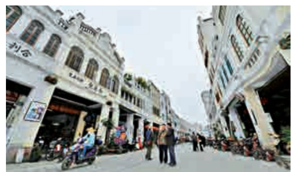
▲修復後的海口騎樓老街街景 中新網

口，形成了海口近代騎樓老街歐亞混合的城市風貌。2009年6月，騎樓老街被國家文化部、國家文物局評為首批「中國歷史文化名街」。記者在現場看到，拆去腳手架的騎樓露出美麗真容，「選環球布疋雜貨總行」、「聚合號」等老字號也精彩呈現。雜貨、布匹、醫藥、書局等商業門類齊全，展示出老海口的繁華風貌。（中新社）