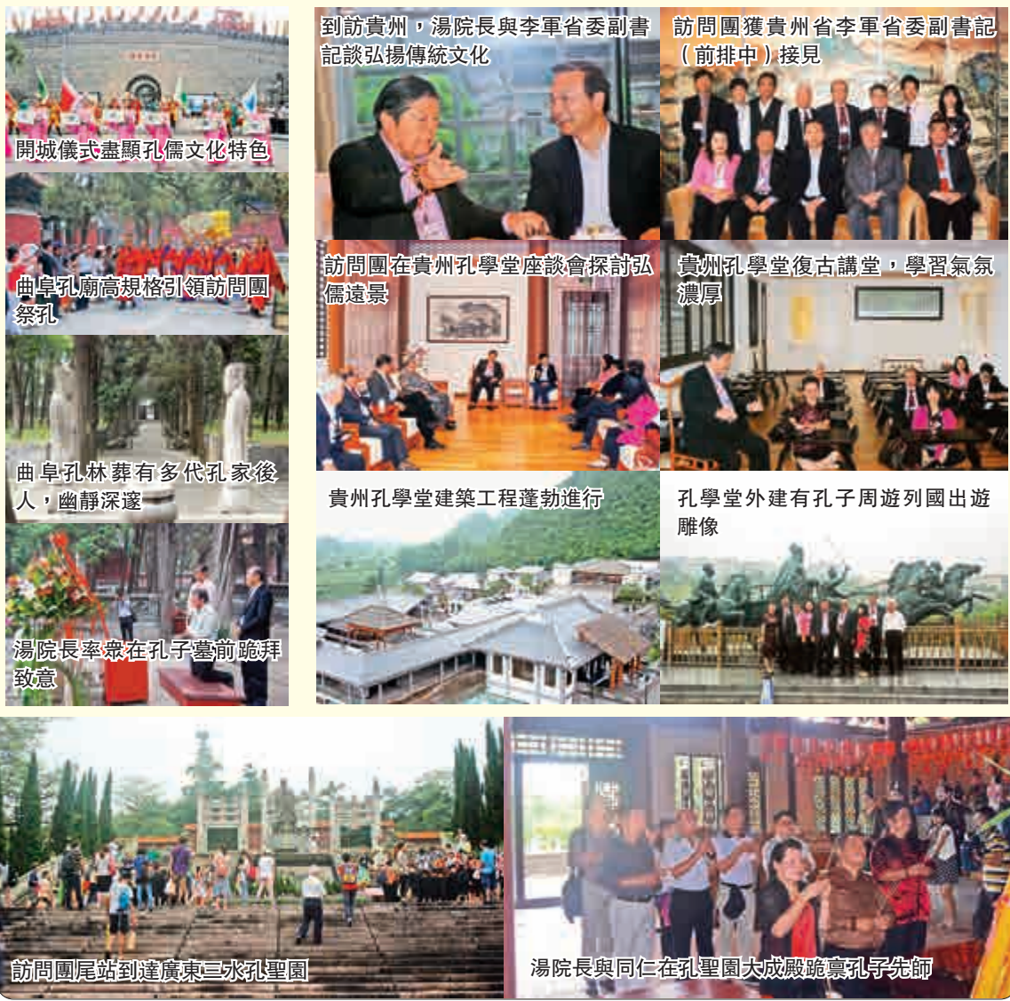
到訪貴州,湯院長與李軍省委副書記談弘揚傳統文化