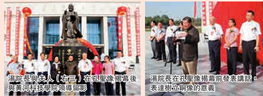
湯院長與夫人(右三)在孔聖像揭幕後與黃河科技學院領導留影