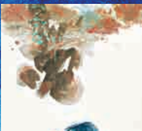
▲梁巨廷作品《川藏風雲》