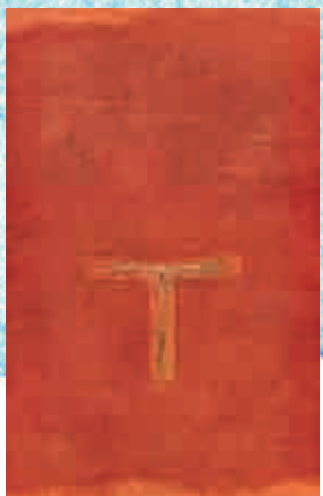
▲梁巨廷七十年代畫作《橙調》已開始嘗試混合媒介的創作