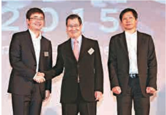
▲移動互聯網兩岸年會13日在台北登場，蕭萬長（中）和獵豹移動執行長傅盛（左）握手致意。圖右為小米科技創辦人雷軍 中央社

倪永傑認為，從安全的角度來看，「海峽中線」已經事實上形同虛設，對於台灣的安全來說根本無法保障，甚至僵固了很多人的思維，「台灣安全的根本保障應該是兩岸的和平發展」。