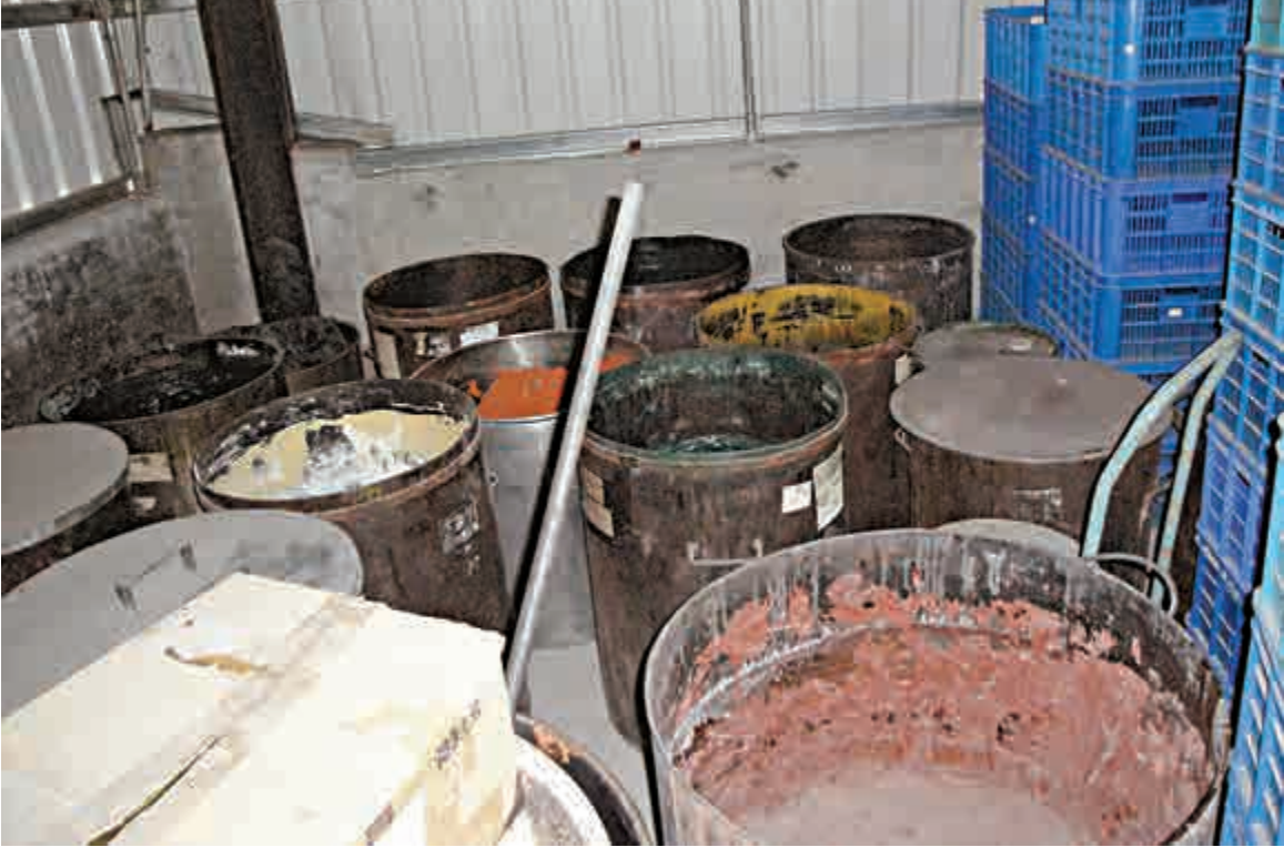
▲以生產金絲膏、消痔丸等藥聞名的GMP藥廠三陽製藥公司，藥房衛生極差

有台媒稱，三陽把廢棄豬舍當成藥品生產線。屋內沒有消毒設備，僅有簡單抽風機，空氣悶熱，藥布半成