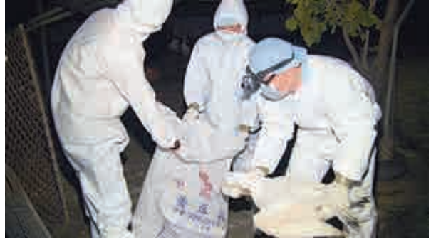
▲嘉義防疫人員13日撲殺染病鵝隻

依據農委會動植物防疫檢疫局統計，本次台灣首波高致病原水禽禽流感疫情至今，鴨、鵝的最高損耗量為254418隻，對比在養量1347萬隻，至今損耗近2%。