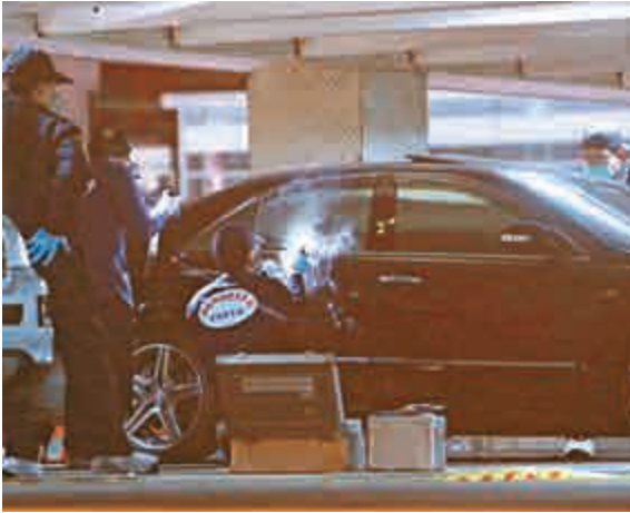
▲台北市13日傳出重大刑案，警員到場蒐證調查 中央社

台灣兩岸共同市場基金會榮譽董事長蕭萬長在會上致辭時表示，移動互聯網符合世界經濟發展趨勢，代表新興產業，帶給年輕人新的力量，也創造新的機會，希望台灣青年能夠抓住機遇，實現夢想。兩岸互聯網的合作可以整合兩岸優勢，創造更多機會。