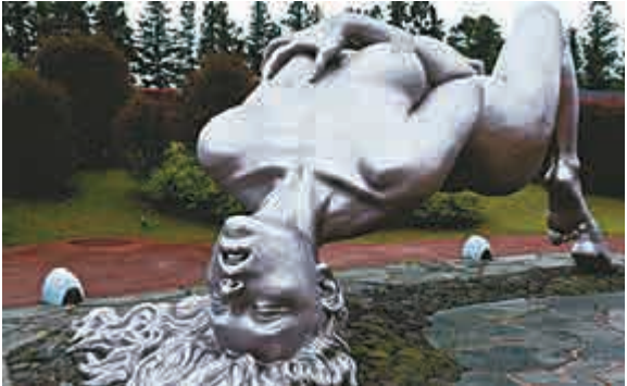
▲韓國濟州島性愛樂園 網上圖片