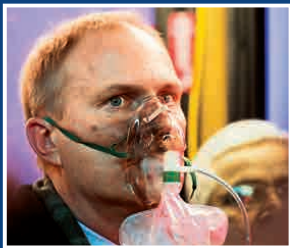
▲有乘客不適需要戴氧氣面罩