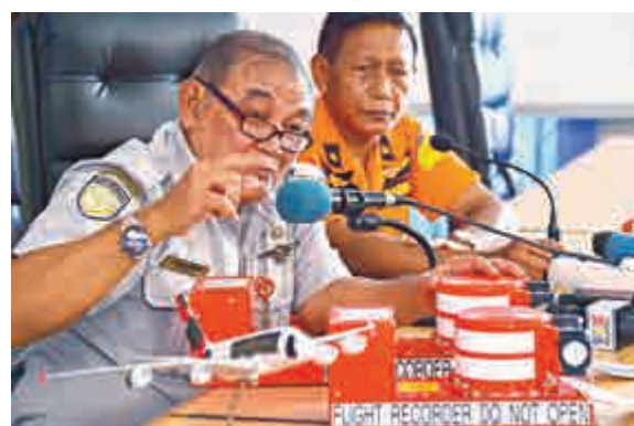
▲印尼交通委員會13日展示尋獲的亞航駕駛艙語音記錄器

黑匣子。此舉已經獲得歐洲航空安全局批准。業內人士稱，過去數年，也先後發生多宗客機失事墜落海洋的事故。飛機製造商同意有必要研發新科技，協助尋找肇事飛機的「黑盒」。