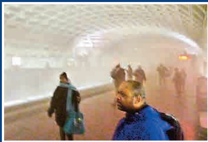
▲濃煙湧入地鐵站，民眾紛紛逃走