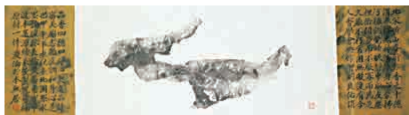
▲劉慶倫作品《香德——黑奇楠》