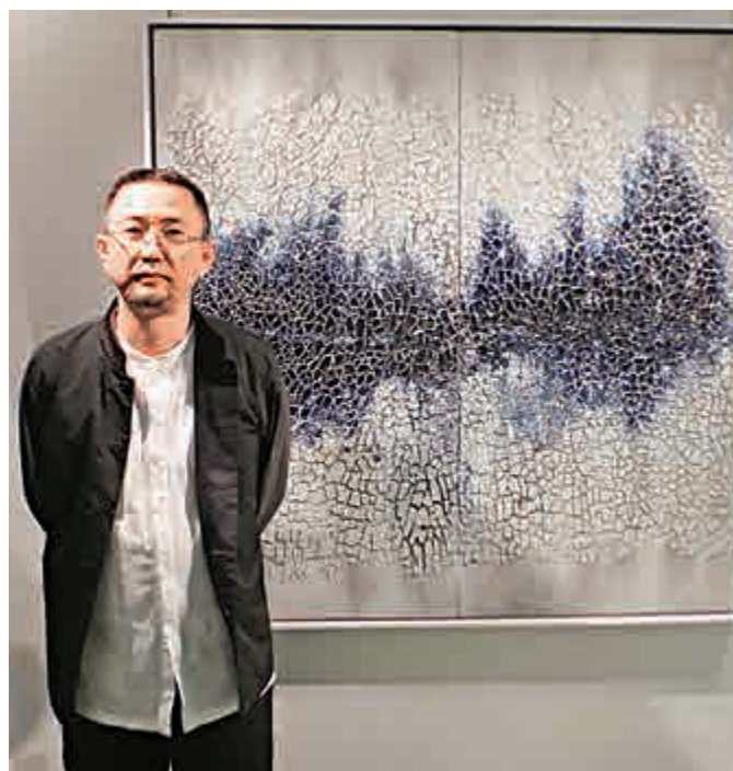
▲戚或與布面陶瓷作品《相態 No.011-02》