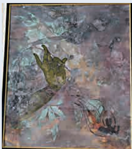
林明俊岩彩作品《慈》