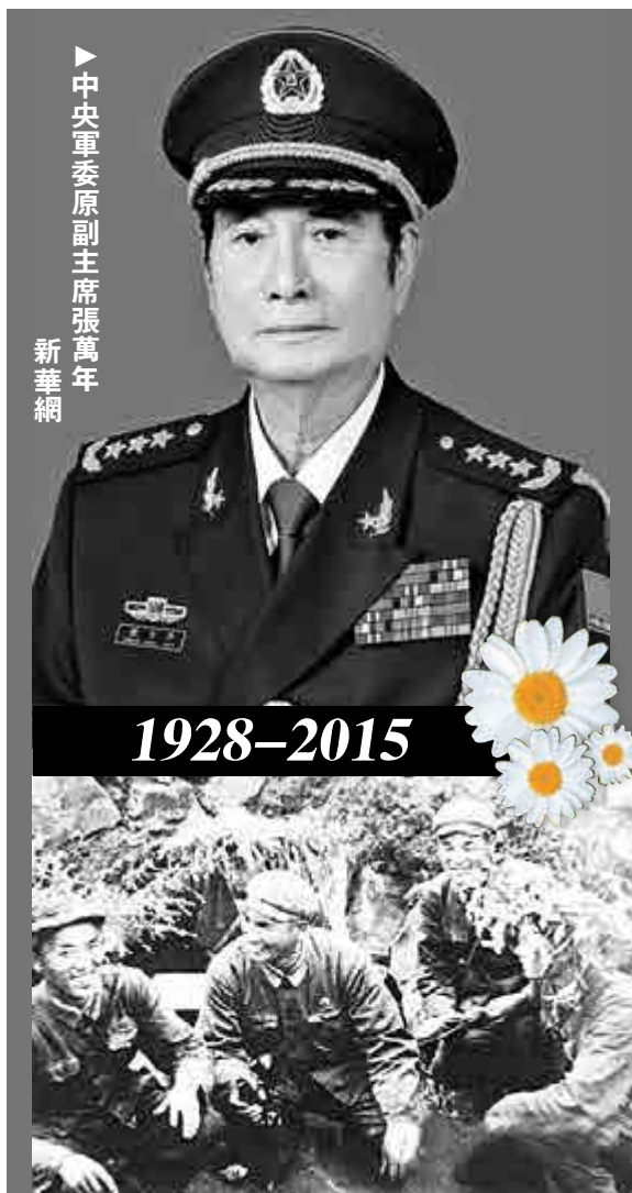
中央軍委原副主席張萬年

1996年，為因應李登輝拋出「兩國論」導致的台海軍事惡化，解放軍於當年3月在台灣海峽組織了陸海空三軍聯合作戰演習。張萬年赴前線坐鎮，並代表