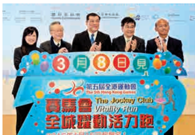
五位主禮嘉賓在新聞發布會上主持「賽馬會全城躍動活力跑」啟動儀式