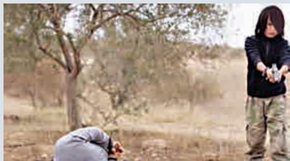
▲男孩朝兩名跪地的男子頭部各開一槍