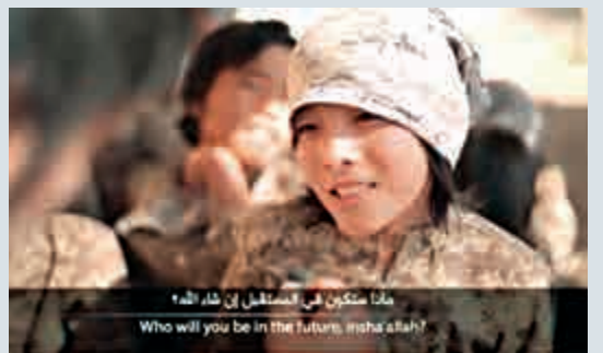
▲這名男孩在ISIS早先的宣傳影片露面 資料圖片