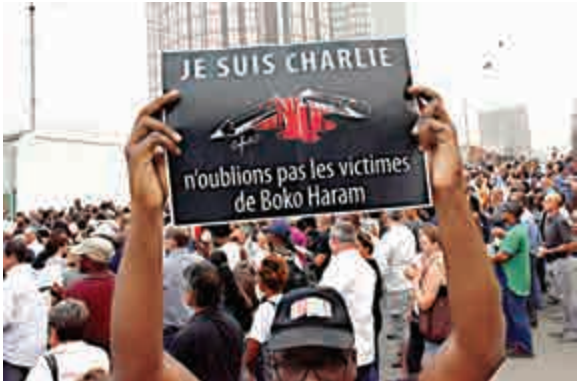
▲一名男子在科特迪瓦城市阿比讓的使館前舉牌「我是查理，但請不要忘記博科聖地的受害者們」

不過共赴巫山後王子馬上變臉，羅伯茨寫道：「他不再是幾小時前我認識的殷勤男子，他很快穿回衣服，說再見並離開了睡房。」