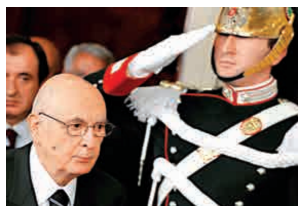
▲現年89歲高齡的意大利總統喬治·納波利塔諾(左)14日辭職

目前已有消息對納波利塔諾的繼任者作出預測，其熱門人選包括前總理、歐盟委員會主席普羅迪和前總理朱利亞諾·阿馬托，他們兩人此前都曾作爲總統候選人參選。