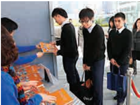
▲《施政報告》建議用三億元成立「青年發展基金」，青年甚有興趣

【大公報訊】《施政報告》建議用三億元成立「青年發展基金」，資助現有計劃未能涵蓋的創新青年發展活動，包括以資金配對的形式，支持非政府機構協助青年創業。消息指，政府希望與非政府機構按「1：1」配對出資，預計每個獲批創業項目可獲20萬資助，三億元資金可資助約1000個項目。