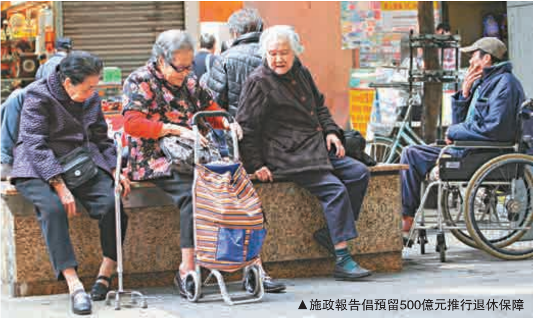
▲施政報告倡預留500億元推行退休保障

報告指，政府會於未來五個財政年度，每年再額外向社區參與計劃撥款2080萬元，進一步加強支援區議會在地區上推廣藝術文化活動。同時於新一屆區議會任期起，增加區議員酬金的15%，即由現時的25000元增加至29000元，並為每名區議員增設每屆任期一萬元的外訪開支撥款。