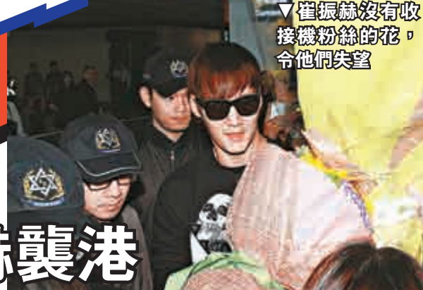
崔振赫沒有接收機粉絲的花，令他們失望

韓劇《急診男女》及《繼承者們》的男演員崔振赫首度來港，昨日中午由韓國飛抵香港，準備出席昨晚在九龍灣展覽中心舉行的粉絲聚會，約有半百粉絲專誠到機場接機，當中不乏奶妃粉絲，他們拉起橫額及紙牌來歡迎偶像。戴上黑超及穿著黑色衛衣的崔振赫，出關時即親親地向現場粉絲揮手，並面帶微笑，由於大會安排六名保安護駕，所以粉絲們都不能埋身，導致現場有些混亂，有粉絲更被迫跌到地上。期間有粉絲想送花給崔振赫，但他沒有接收，令粉絲大為失望。據悉崔振赫將於今年上半年入伍，此次亞洲粉絲見面會是他入伍前最後的海外公開活動。