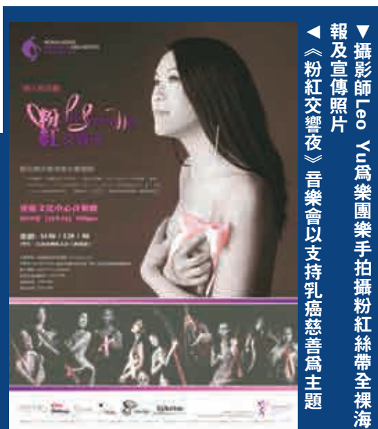
▲攝影師Leo Yu為樂團樂手拍攝粉紅絲帶全裸海報及宣傳照片 《粉紅交響夜》音樂會以支持乳癌慈善為主題