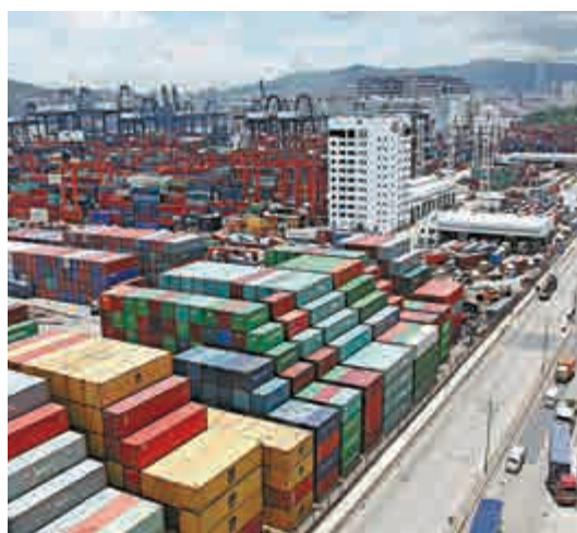
▲去年全球港口的吞吐量增幅約4%，本港碼頭吞吐量的增長遠低於全球水平