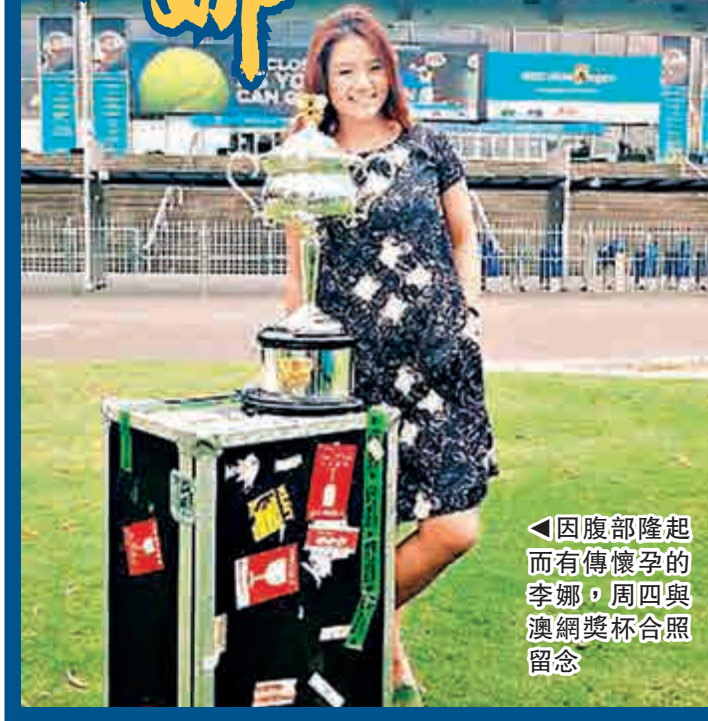
◀因腹部隆起而有傳懷孕的李娜，周四與澳網獎杯合照留念