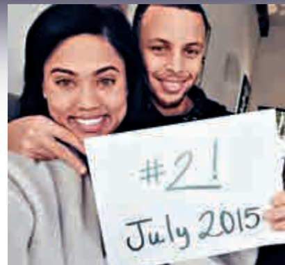
▲史提芬居里(右)在社交網站向球迷報喜，指其太太將於七月誕下第二胎

賽後勇士亦寫下主場15連勝，追平球隊於1983至90年度創出的單季主場連勝紀錄，主帥史提夫卡爾亦喜道：「不