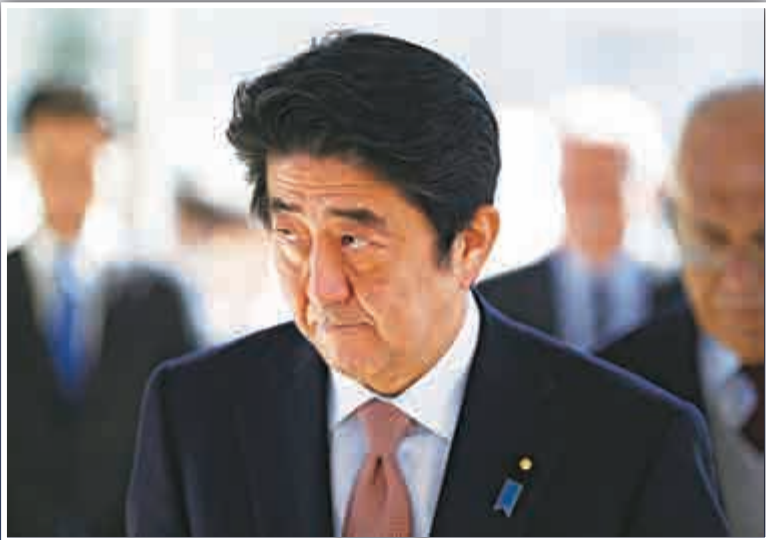
▲日本首相安倍晉三20日參觀約旦河西岸的阿拉法特墓園

周二的視頻也讓人想起2004年11月的事件，那時日本在伊拉克有550名駐兵，作為美國領導的聯盟的一部分，24歲的日本人質香田澄生被尋求撤軍的武裝組織綁架並斬首。當時的日本首相小泉純一郎拒絕了撤軍要求。「我們不能輸給恐怖主義。」小泉說，「我們不能向野蠻力量屈服。」