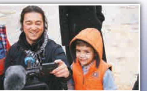
▲後藤健二是日本有名的戰地記者