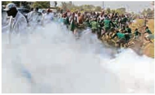
▲警方向示威的小學生釋放催淚彈

肯尼亞國內安全部長表示，這一具有爭議的操場屬於蘭加塔小學，小學已經使用了這一操場至少40年。