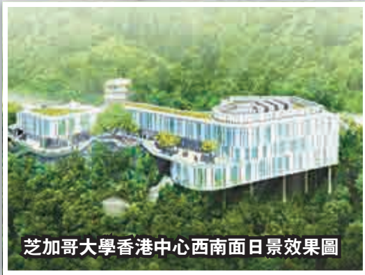
芝加哥大學香港中心西南面日景效果圖