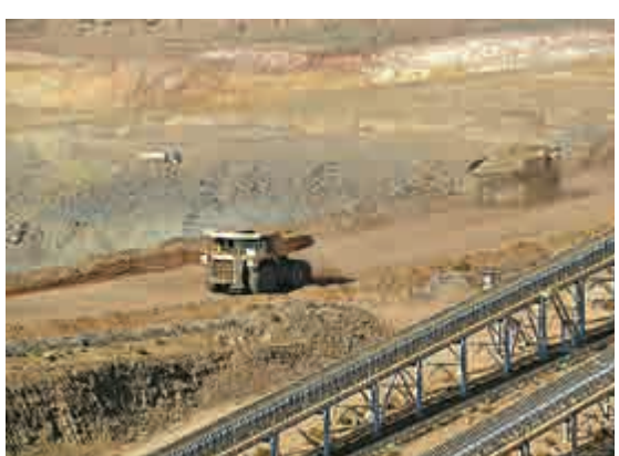
▲中信須為澳洲鐵礦項目作大額撥備

另外，中信交代中澳鐵礦項目進度，第三至第六條生產線的建設正按計劃進行，其中，第三和第四條的調試預期在2015年底前開始，第五和第六條線的調試則會在2016年進行。中信重申，預計到2016年底，整個項目將全面建成投產。