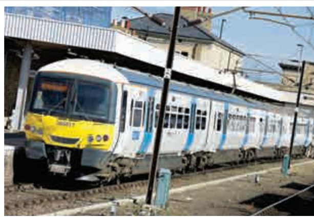
▲長建又再大手筆投資交通項目

長建昨日股價先升後跌，早段抽高0.7%至61.2元高位，收市倒跌0.1%，報60.7元。