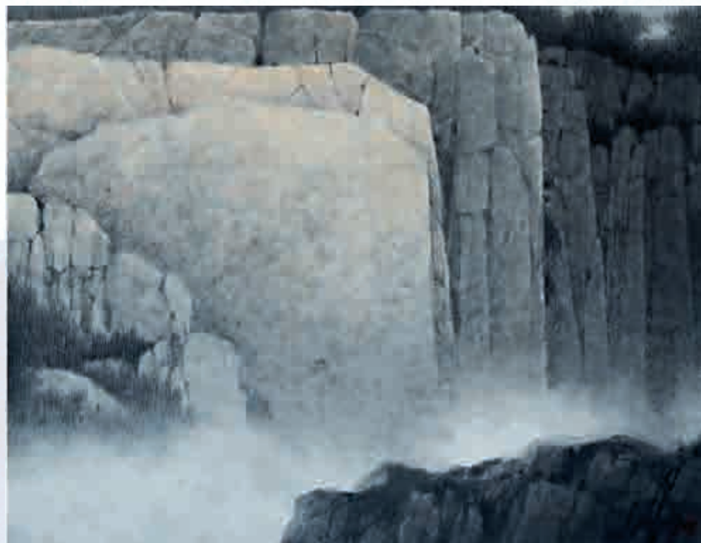
▲《石敢當——泰山寫生》(局部)