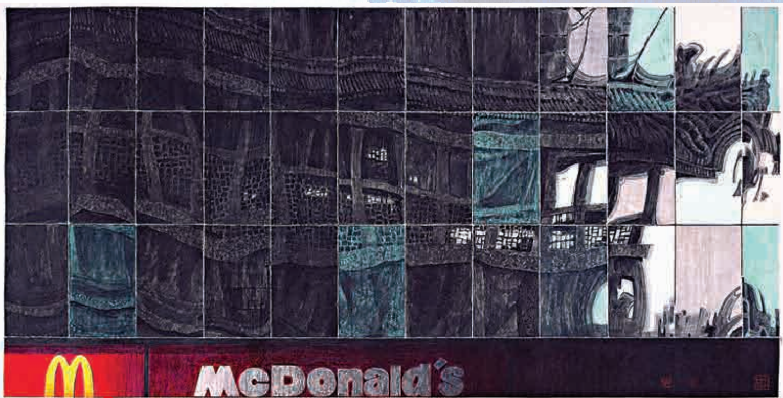
▲《幕牆山水之西安鐘樓》