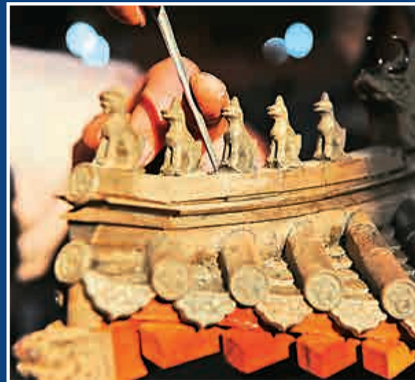
▲紫檀木雕刻是木雕中最困難的一種，是國家級非物質文化遺產